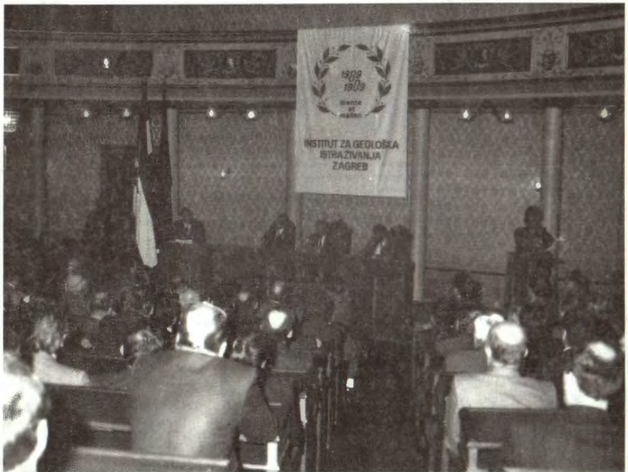
Sa proslave 80-god. Instituta za geološka istraživanja u velikoj dvorani Starogradske vijećnice.

Novoformirani Odbor odmah je započeo s radom. Tako je već na prvim sastancima napravljen operativni plan i koncepcija proslave. Odlučeno je da